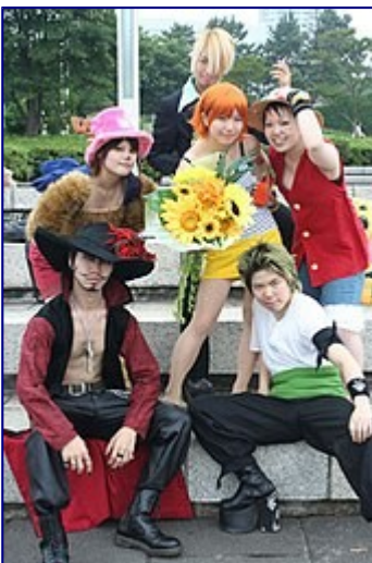
Cosplay di One Piece

Il termine è una contrazione delle parole inglesi costume e play , che descrivono l' hobby di divertirsi vestendosi come il proprio personaggio preferito. Oltre a travestirsi in occasione di manifestazioni pubbliche come i convegni sugli anime , non è inusuale per gli adolescenti giapponesi radunarsi assieme ad amici con la stessa passione solo per fare del cosplay.