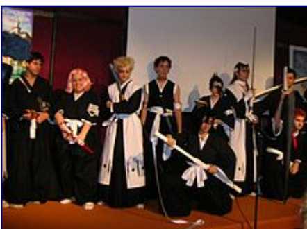
Cosplay di gruppo di BLEACH