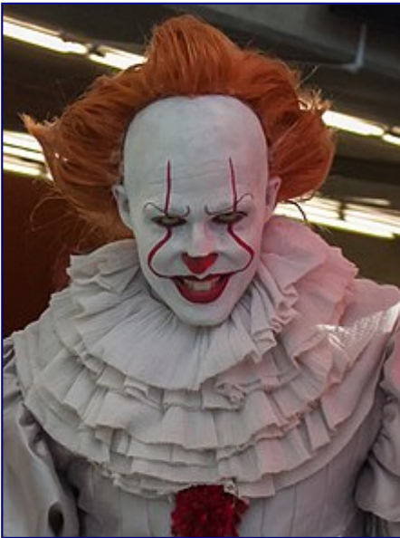
Cosplay di Pennywise .

A causa della sua natura eterogenea il cosplay viene praticato in maniera sensibilmente differente nei vari stati in cui si è diffuso, ma il terreno principalmente calcato dai cosplayer è quello delle convention del settore. Una piccola nicchia in questo campo è costituita dai dollers , il termine che indica un attore dilettante di kigurumi . Questi cosplayer indossano maschere (che li fa definire in giapponese anche animegao , ovvero "faccia da anime") e una calzamaglia completa per trasformarsi completamente nel loro personaggio.